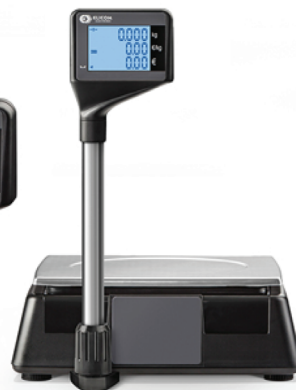
Μοντέλο S300 LM Με Πύργο