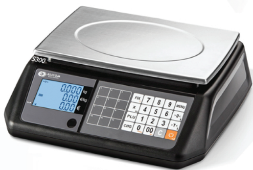
Μοντέλο S300 FM Χωρίς Πύργο

Μοντέρνος σχεδιασμός! Τεχνολογία αιχμής!